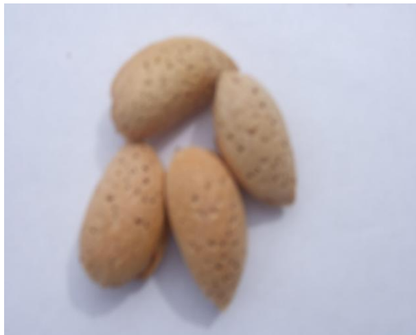
Расм.. 2. Бодомнинг маҳаллий нави Гўзал.

Қурғоқчиликка ўта чидамли. Ҳосилдорлиги дарахтидан 4,5 кг-дан 13 кг-гача. Пўчоғи юмшоқ, оч жигар рангли, апрел ўрталарида гуллайди, меваси август охирида пишади. Мевасининг ўртача оғирлиги 2,39 г (418 донаси 1 кг келади), 47,5% мағиз чиқади, 59,9% еғи бор, 3-4 чи йили ҳосилга киради (расм 1).