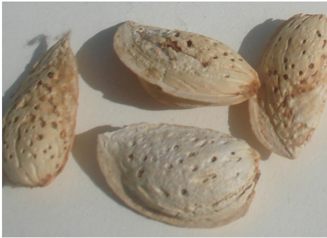
Расм 7. Бодомнинг маҳалий нави Консой.

Консой - жойдори нав, табиий танлаш йўли билан ажратилган. Қурғоқчилик ва баҳорги қора совуқларга нисбатан чидамли. Пўчоғи юмшоқ, оч жигарранг, апрел бошларида гуллайди, меваси август охирида ёки сентябр бошларида пишади. Ҳосилдорлиги дарахтнинг ўсиш шароитига қараб 3-8 кг гача. Мевасининг ўртача оғирлиги 2,09 г. Мағзи бодомнинг 48% ни ташкил қилади, таркибида 55% ёғ бўлади, мағизи ширин, 3-4 чи йили ҳосилга қиради (расм 7).