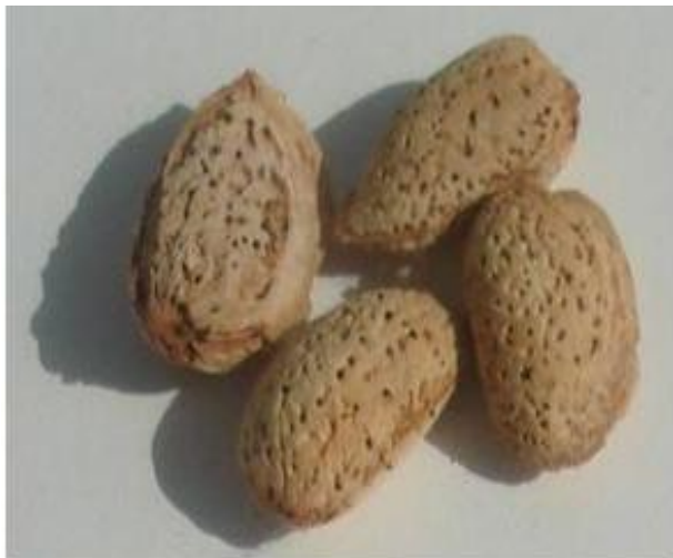
Расм 1. Бодомнинг маҳаллий нави Колхозчи.

Колхозчи маҳаллий нави - жойдори нав танлаш йўли билан ажратилган.