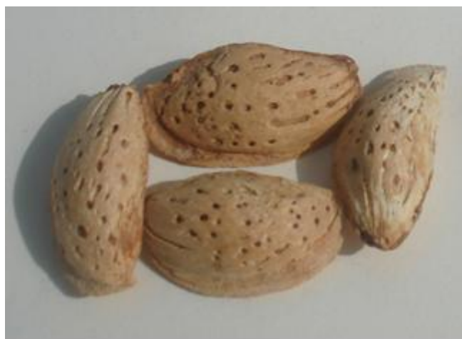
Расм. 3. Бодомнинг маҳаллий нави Тян-шон.

Тян-шон маҳаллий нави жойдори нав, танлаш йўли билан ажратилган. Эртароқ гуллашига қарамасдан, баҳорги қора совуқларга нисбатан чидамли. Ҳосили йирик ва юпқа, дарахтидан суғориладиган ерларда 8-10 кг-гача, лалмикор шароитда 4-5 кг-гача ҳосил