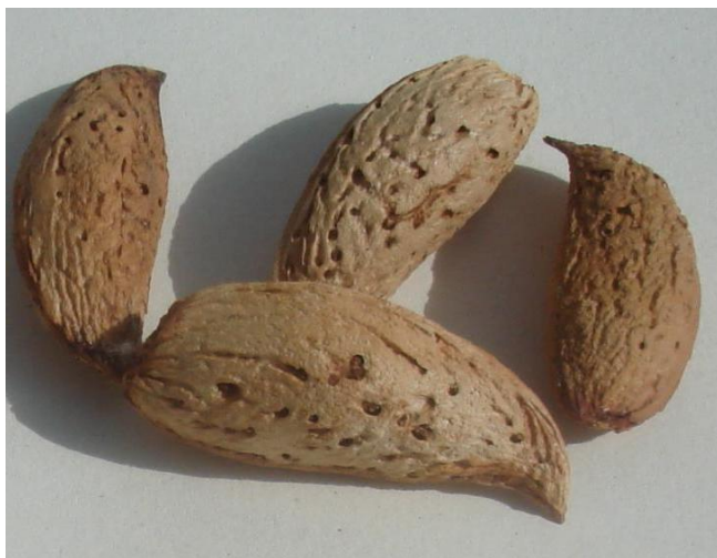
Расм. 6. Бодомнинг маҳалий нави Заветный.

яратилган. Ҳосилдорлиги дарахтидан 4-12 кг-гача. Стандарт пўчоғли, оч жигар рангли. Апрельнинг биринчи ярмида (3-15.04) гуллайди, меваси 9-20 сентябрда пишади. Ҳосилдорлиги дарахтидан 4 кг-дан 12 кг-гача. Мевасининг ўртача оғирлиги 2,12 г ( 472 донаси 1 кг келади), 44,1% мағиз чиқади, таркибида 59,6 % ёғ бўлади, мағизи ширин, 3-4 чи йили ҳосилга киради (расм 4.).