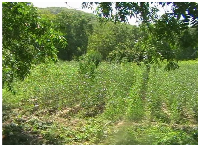
Расм. 11. Бодом кўчатзори.

Пайвандлаш олдида кучатзор албатта суғорилади ва танаси пастки бачки новдалардан тозаланади. Бодом июлнинг учинчи декадасидан сентябрнинг биринчи декадасигача, мевачиликда кулланидиган оддий «Т»-усулида уланади (расм 12). Икки ҳафтадан сўнг пайванднинг тутган ёки тутмаган миқдори аниқланади ва тутмай қолганлари бодомнинг пайвандостга олдин уланган ўша нав куртаги билан қайтадан пайвандланади. Кузда пайванд боғлами бир оз бўшатиб кўйилади ва қиш давомида боғланма олиб ташланмайди. Келгуси йил эрта баҳорида кўчатнинг пайванд қилинган жойидан тепа қисми батамом кесиб ташланади. Тутмай қолган пайвандлар ўрнига янги ўсиб чиққан куртакларни қайта пайванд қилиш мумкин бўлади.