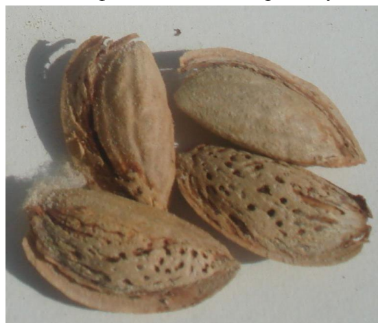
Расм. 5. Бодомнинг ўзбек нави Ўзбек галвираги.

яратилган. Ҳосилдорлиги дарахтидан 4-12 кг-гача. Стандарт пўчоғли, оч жигар рангли. Апрельнинг биринчи ярмида (3-15.04) гуллайди, меваси 9-20 сентябрда пишади. Ҳосилдорлиги дарахтидан 4 кг-дан 12 кг-гача. Мевасининг ўртача оғирлиги 2,12 г ( 472 донаси 1 кг келади), 44,1% мағиз чиқади, таркибида 59,6 % ёғ бўлади, мағизи ширин, 3-4 чи йили ҳосилга киради (расм 4.).