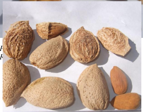
Расм. 10. Бодом нави Зарина.