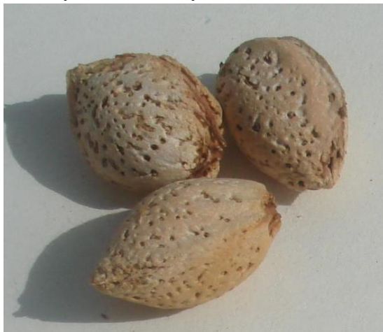
Рис. 4. Бодомнинг маҳалий нави Бустонлик.

Кеч гуллайдиан Бустонлик нави - бодом ва шафтолини чатиштириш йўли билан