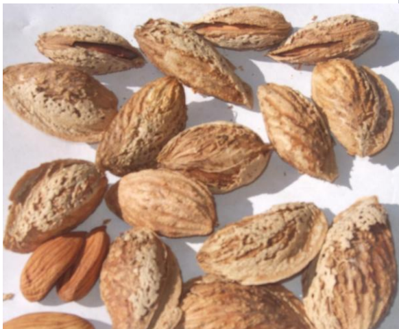
Расм. 9. Бодом нави Малика.